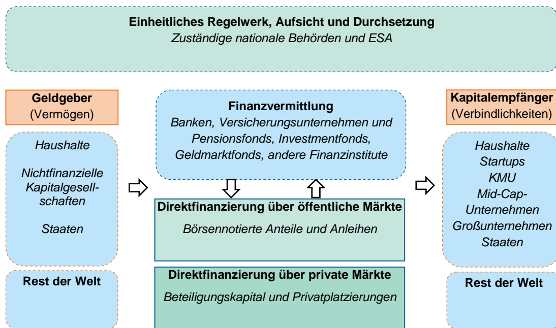
Abbildung 1: Schematischer Überblick über die Kapitalmärkte im Finanzsystem

In den letzten Jahrzehnten sind die Kapitalmärkte in der EU stark gewachsen. So stieg die Börsenkapitalisierung in der EU von 1,3 Billionen EUR im Jahr 1992 (22 % des BIP) bis Ende 2013 auf insgesamt rund 8,4 Billionen EUR (ca. 65 % des BIP) an. Die ausstehenden Schuldverschreibungen erreichten im Jahr 2013 einen Gesamtwert von über 22,3 Billionen EUR (171 % des BIP), im Vergleich zu 4,7 Billionen EUR (74 % des BIP) im Jahr 1992 3 .